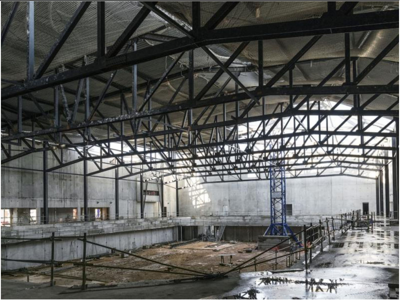
La charpente métallique salle du Jeu de Paume